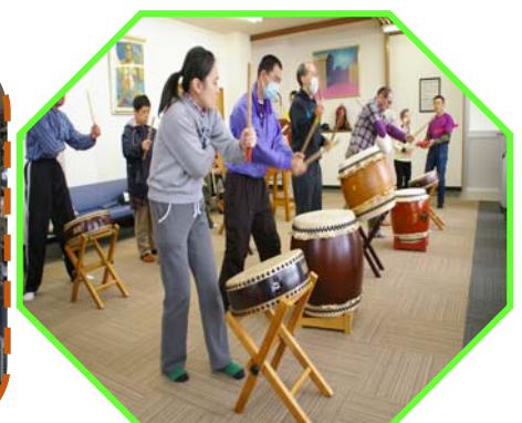
太鼓クラブ練習風景