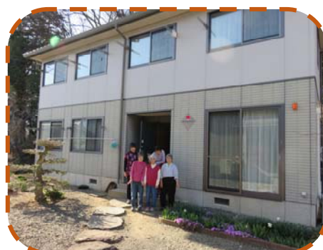
第2あなやまハイツ