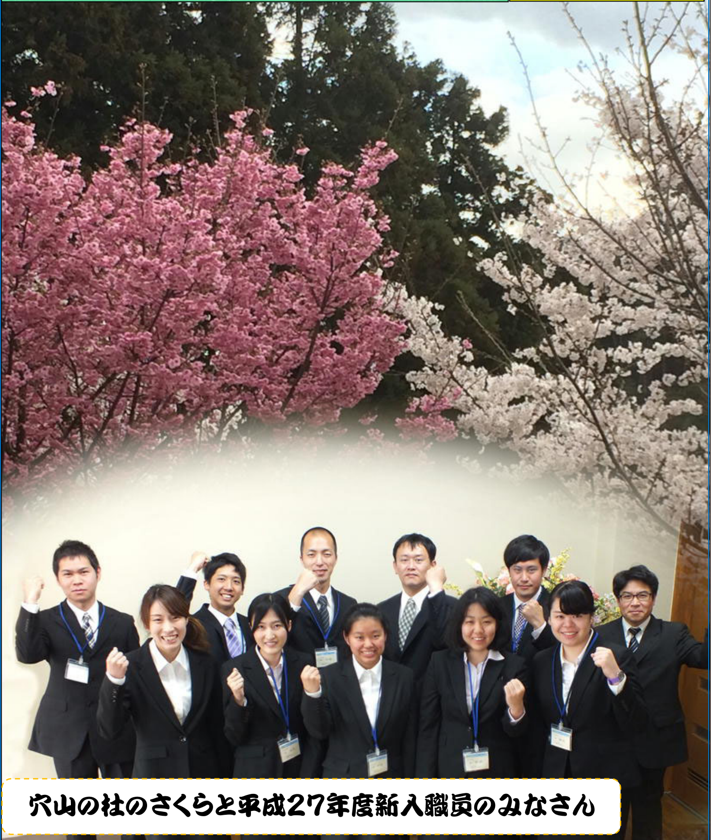
穴山の社のさくらと平成27年度新入職員のみなさん