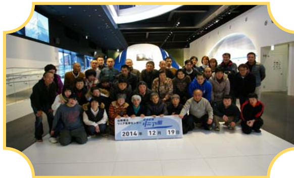
リニア見学センターへの遠足