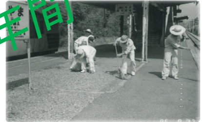
今も継続している地域清掃 (JR穴山駅清掃)