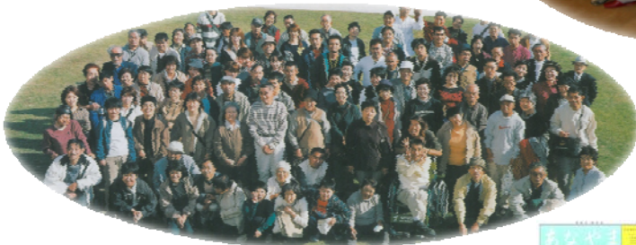
穴山の里 利用者と家族の一泊旅行