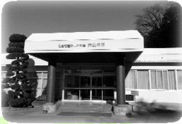
1986年～ (昭和61年) 社会福祉法人 信和会 設立