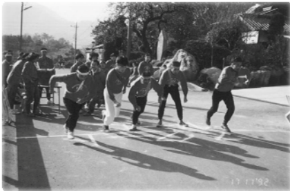
1991年～ 穴山の里 マラソン大会