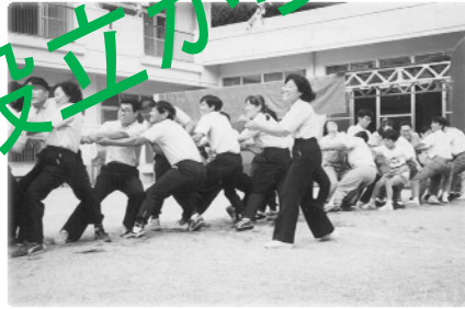
穴山の里 大運動会