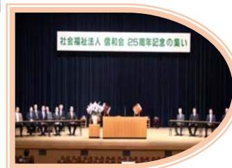
2010年 創立25周年記念式典