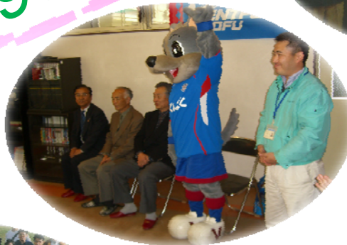
VF甲府応援サポーター 入会式