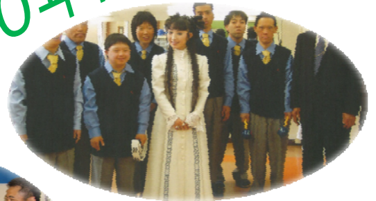
2005年 引田天功さん 来園